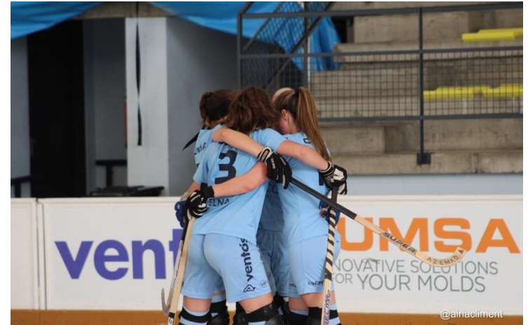
Figura 1: Equip del Hoquei Club Sant Just